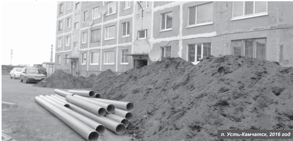
п. Усть-Камчатск, 2016 год