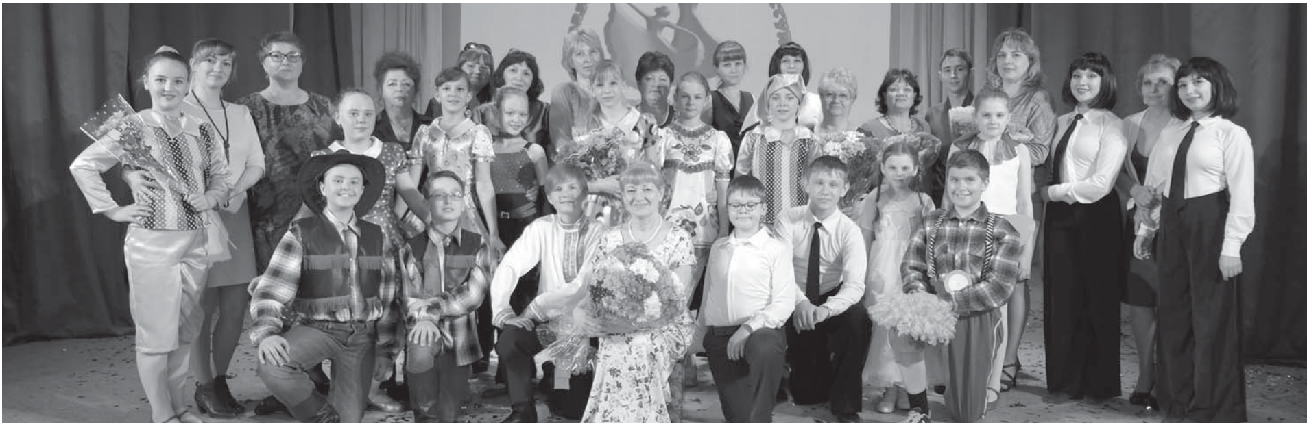
Образцовая хореографическая студия «Фиеста» отметила свой 15-летний юбилей большим, красочным бенефисом.